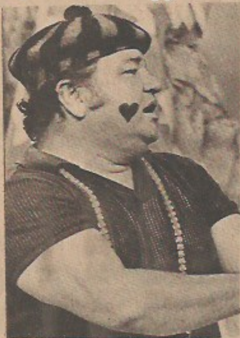
Serafin Sin Fin

Actuando en reacción a demandas de la Comunidad de Orgullo Gay que fueron apoyadas por la Asociación de Periodistas de Puerto Rico, el comediante José Miguel Agrelot anunció el 3 de abril el fin de su personaje "Serafin Sinfin."